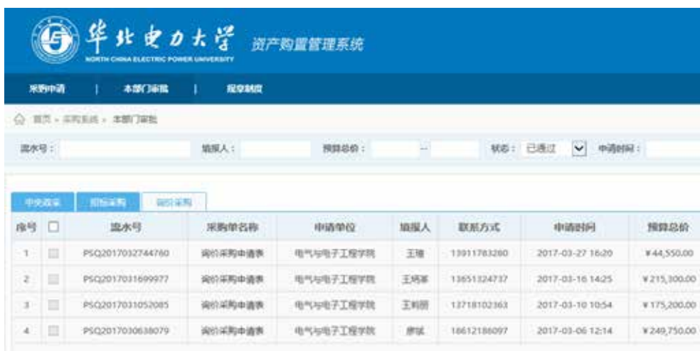
图 2 华北电力大学实践教学管理系统