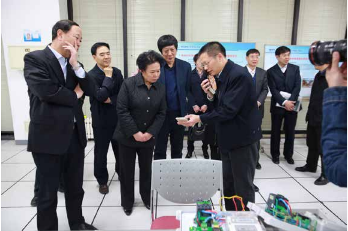
图 6 2016 年 03 月 25 日教育部党组成员王立英一行参观实验室 (三) 其它对示范中心发展有重大影响的活动等。