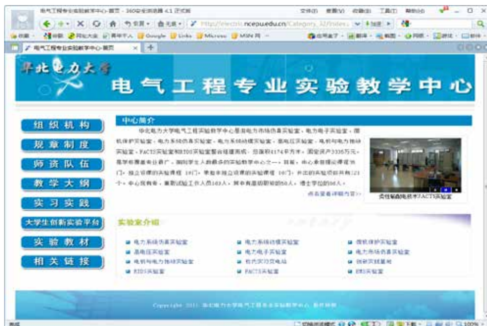
图 1 电气工程实验教学中心网站

中心网站： http://electric.ncepu.edu.cn/dqgc/