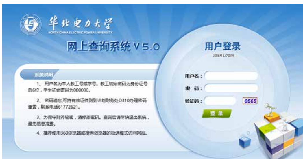
图 3 华北电力大学资产购置管理系统